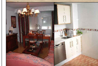
Salón - comedor