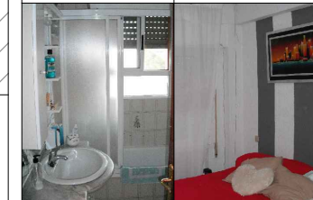
Baño Dormitorio 1