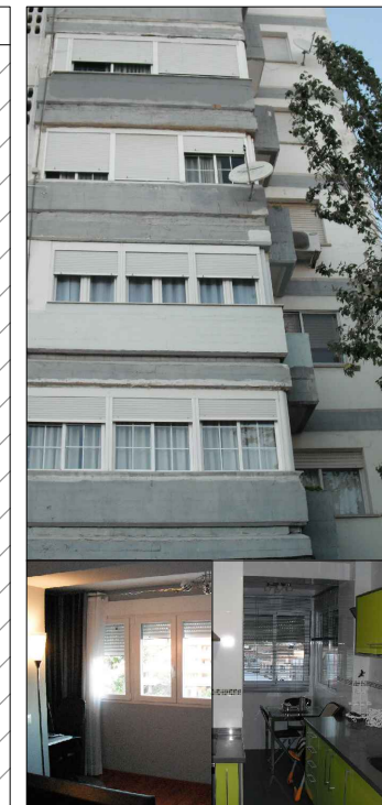
Salón - comedor Cocina