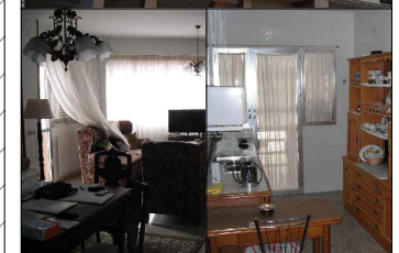
Salón - comedor