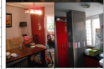
Salón - comedor