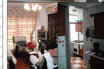
Salón - comedor