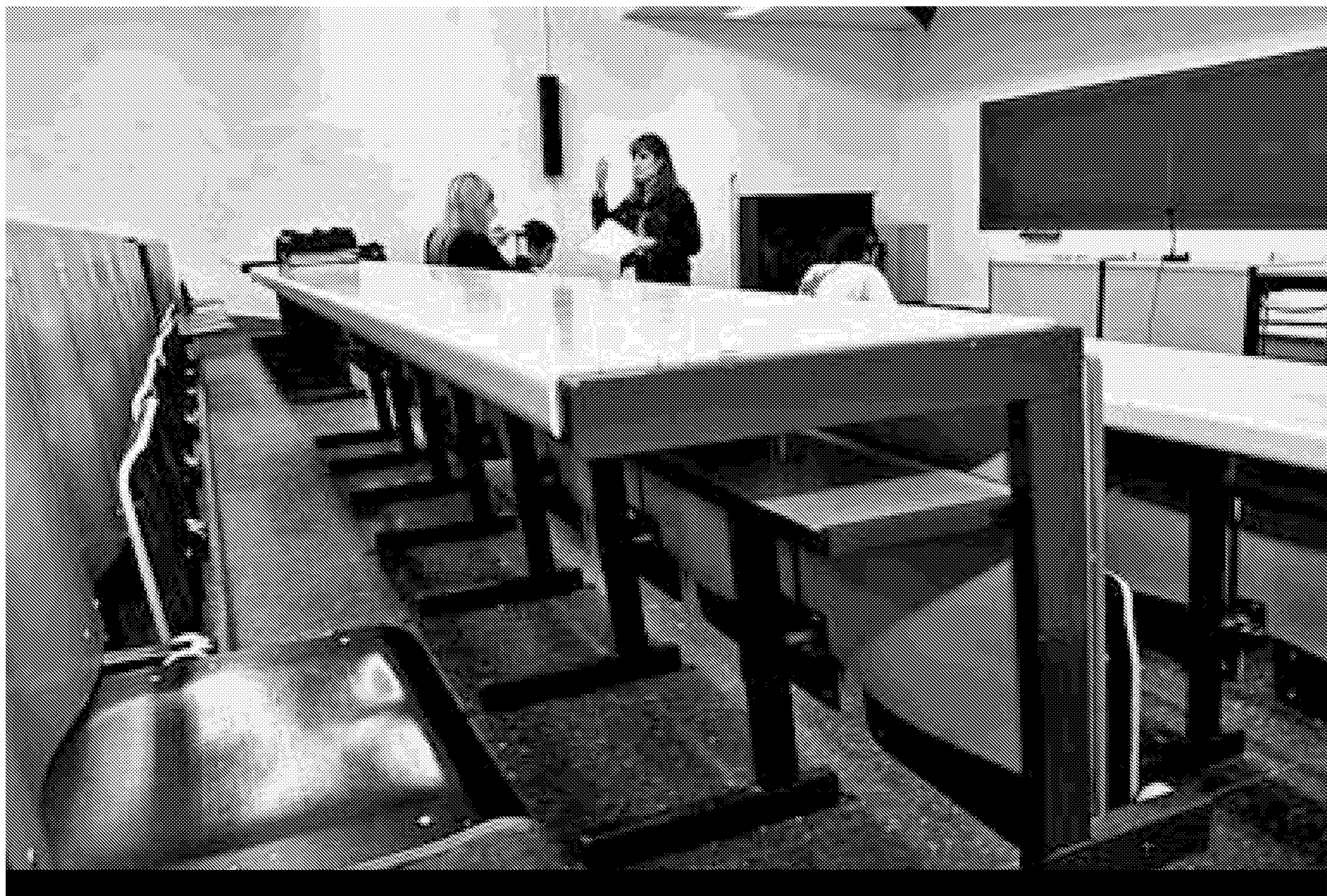
Aula universitaria prácticamente vacía durante la celebración de una clase, una imagen cada vez más frecuente.