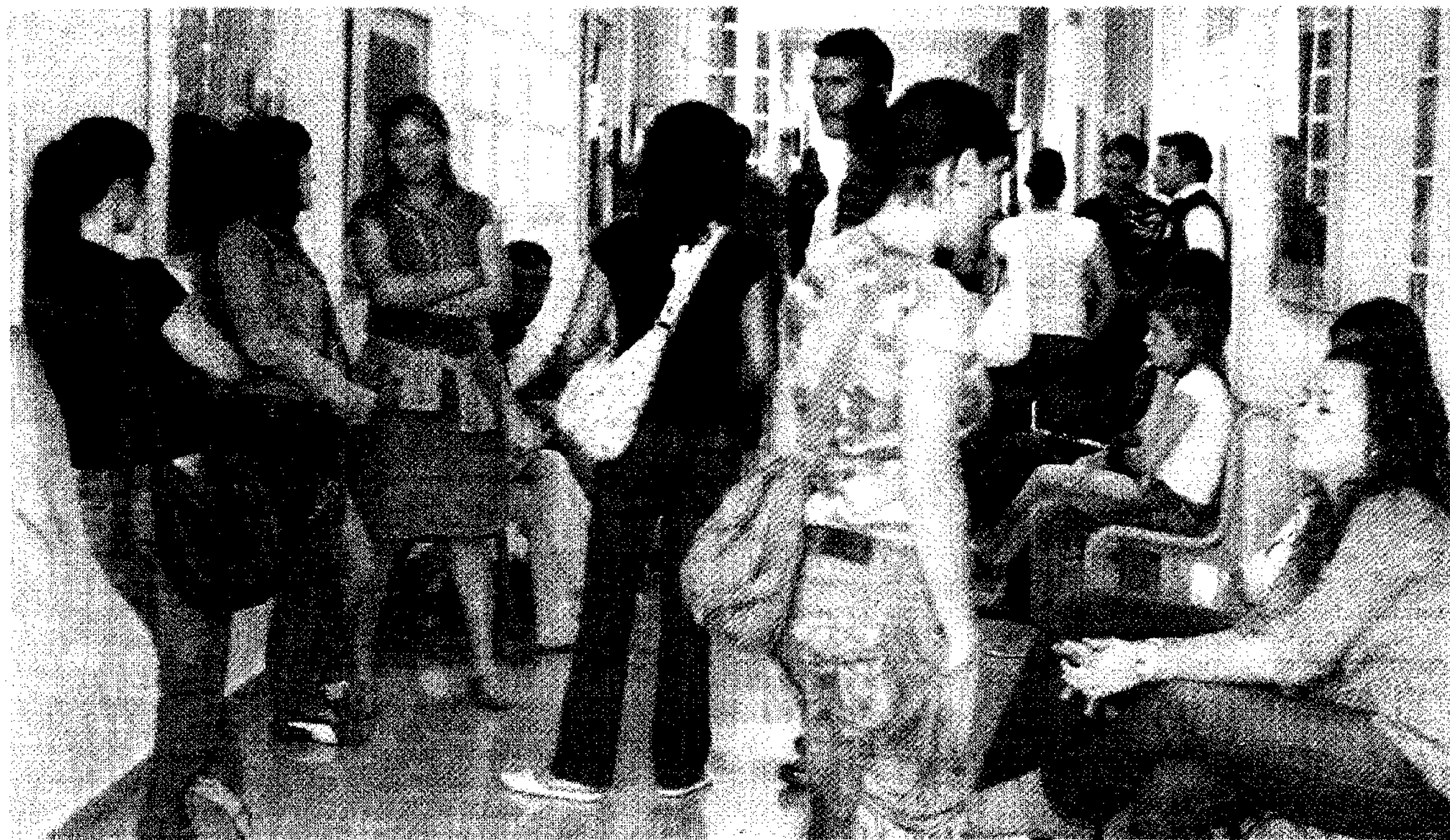
Más de 20.000 estudiantes de la Universidad de Huelva participaron en las Encuestas de Satisfacción sobre la Calidad Docente 2007/08.

El grado de satisfacción global de los estudiantes de la Onubense es de 7,56 sobre diez, nota que fue el pasado curso un 8% superior a la obtenida por la institución académica en el ejercicio 2004/05