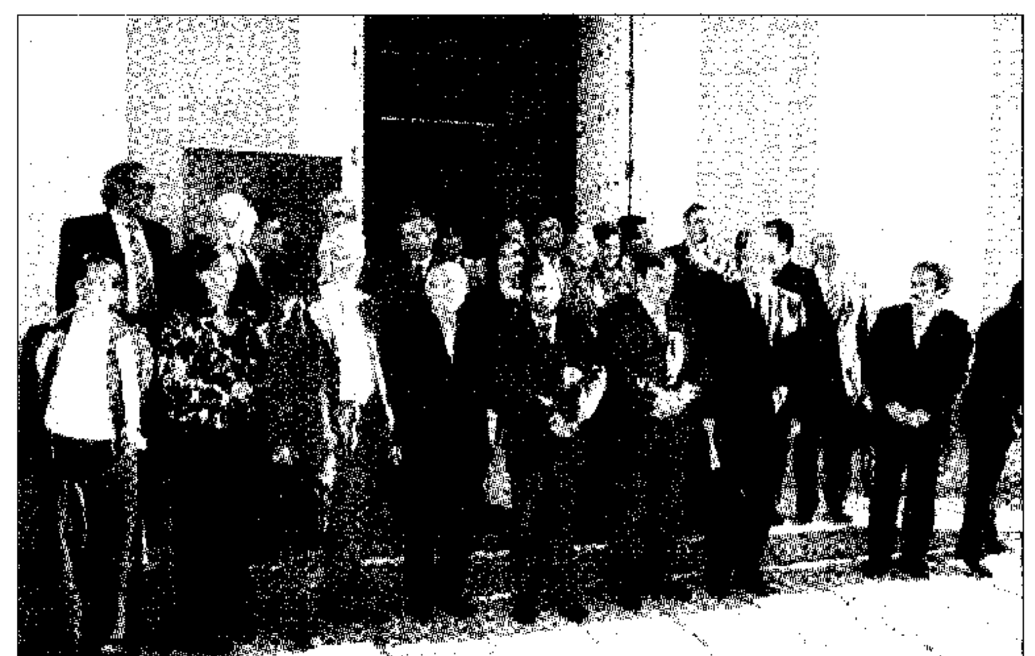
Una treintena de rectores han participado en el encuentro.

Una treintena de rectores de España y Portugal trabajan en la actualidad para definir proyectos concretos para facilitar la movilidad entre Europa e Iberoamérica.