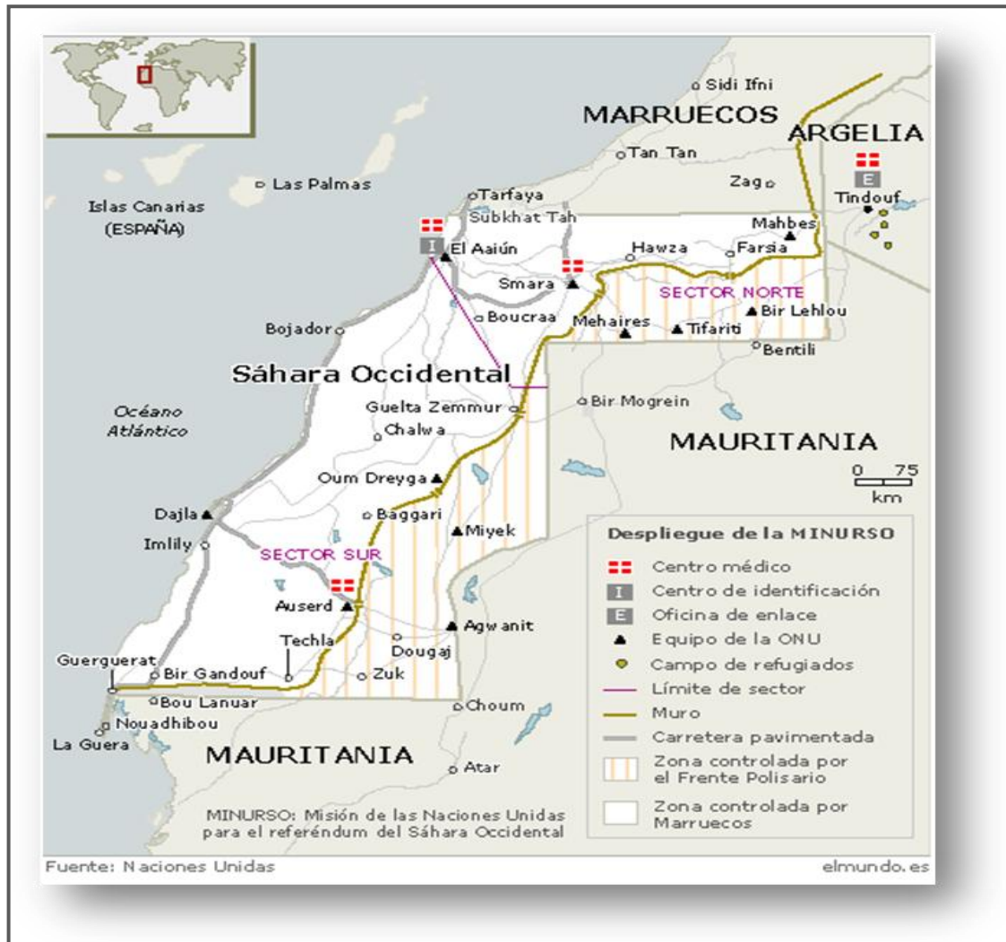
Imagen 2: Territorio del Sahara Occidental actualmente.

entre Marruecos, Mauritania y España que deciden establecer una administración provisional y el territorio es repartido entre Marruecos y Mauritania.