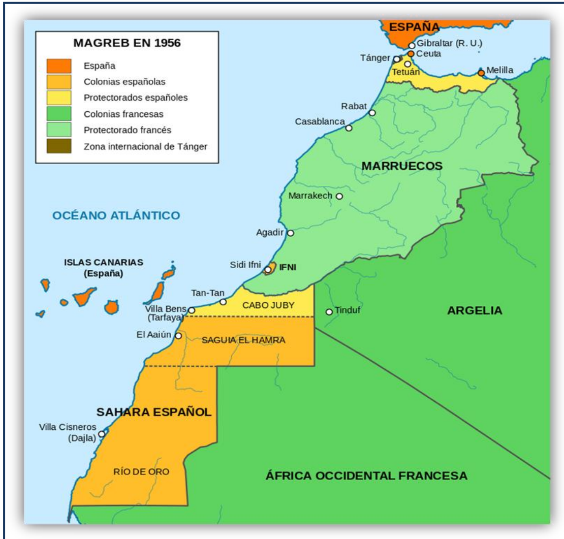
Imagen 1: Magreb en 1956

La situación se vuelve controvertida, surgiendo en el año 73 el Frente Polisario (Frente de Liberación de Saguia El Hamra y Río de Oro). Tras su creación comenzó una lucha armada, por ello España optó por celebrar un referéndum de autodeterminación, caso que quedó en manos del Tribunal de la Haya, órgano que concluyó otorgándoles la libre determinación al pueblo saharaui, a través de la resolución 3458 B del 10 de diciembre de 1975. A pesar de ello Marruecos, el día 6 de Noviembre desobedeciendo al Tribunal de la Haya lleva a cabo la llamada Marcha verde 15 , atravesando la frontera colonial, a consecuencia de ello España decide abandonar el Sahara el día 14 de ese mismo mes tras la firma del acuerdo Tripartito