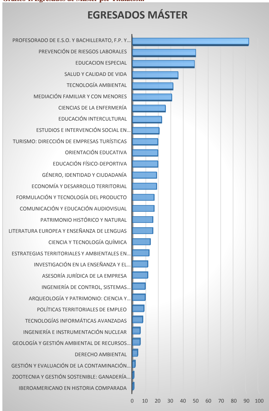
Gráfico 1. Egresados de Máster por Titulación.