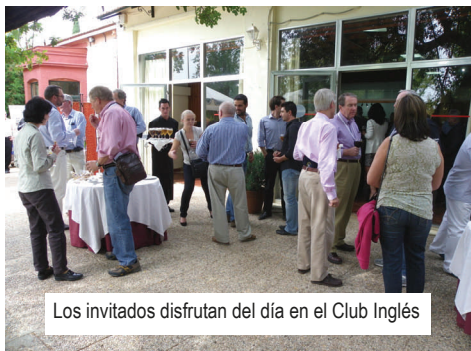
Los invitados disfrutaron del día en el Club Inglés

Tras su visita a las instalaciones de EMED y al Museo Minero, el grupo de 50 representantes de las instituciones financieras multi-millonarias que conforman Resources Capital Fund, asistieron al evento organizado en el Club Inglés Bellavista, donde tuvieron la oportunidad de conversar con los directivos de EMED Tartessus y representantes de la sociedad local y otros actores importantes, incluyendo la Embajadora de Australia en España, alcaldes de la Cuenca Minera, representantes de la industria minera andaluza, de los empresarios y los sindicatos. La cultura estuvo presente, ya que se presentó a los accionistas el programa de Alianza Cultural con Broken Hill y Banská Štiavnica, por parte de su promotor en Australia, Robin Sellick. Se preparó una exposición de arte de las tres localidades, que fue todo un éxito ya que los artistas vendieron varias obras como muestra de que la cultura puede ser un motor para el desarrollo local y el turismo sostenible.