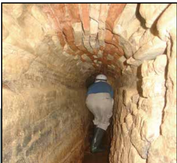
Galería sur bóveda