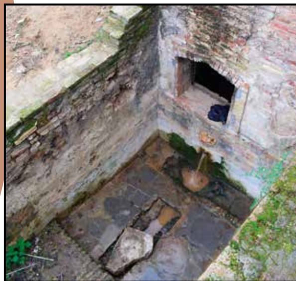
Exterior Fuente Vieja

Además, a buen seguro debió surtir la demanda de la flota de este puerto, tan necesaria no solo para las actividades de consumo propio sino para los navíos que circulaban y trasegaban por las rutas comerciales de larga distancia mediterráneas y atlánticas.