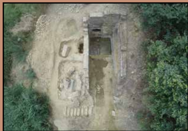
Fotografía aérea de la Fuente Vieja

En el subsuelo del sector B-2 de la Zona Arqueológica de Huelva, correspondiente a El Conquero-La Orden, se localizan los restos arqueológicos del acueducto que abastecía de agua a la Huelva romana, la Onoba Aestuaría de las fuentes clásicas. Se trata de una compleja estructura dotada de una gran significación histórica para la ciudad -en uso hasta mediados del s.XX- ya que cobra un especial protagonismo como obra de ingeniería hidráulica que abasteció no solo la población, sino la demanda portuaria. De hecho, se aprecia una importante relación entre dicha obra y el desarrollo, en momentos Alto imperiales, en la ciudad de un importante barrio pesquero orientado a la transformación de los recursos del mar, en la zona del puerto.