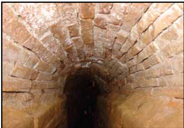
Detalle bóveda galería sur