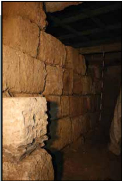
Sección de puerta