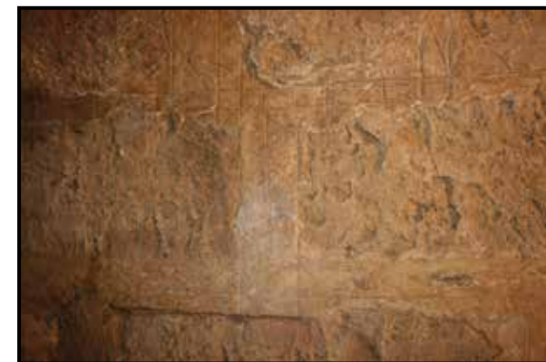
Detalle de reforma islámica

El estudio paramental de la muralla con una potencia conservada de más de tres metros, permite establecer una altura próxima a los ocho metros, de lo que se deduce que la puerta enmarcaría un gran vano de acceso, similar al de otros conjuntos amurallados del periodo prerromano y romano en la Península Ibérica, caso de los recintos fortificados de las ciudades de Cartagena y Carmona entre otras.