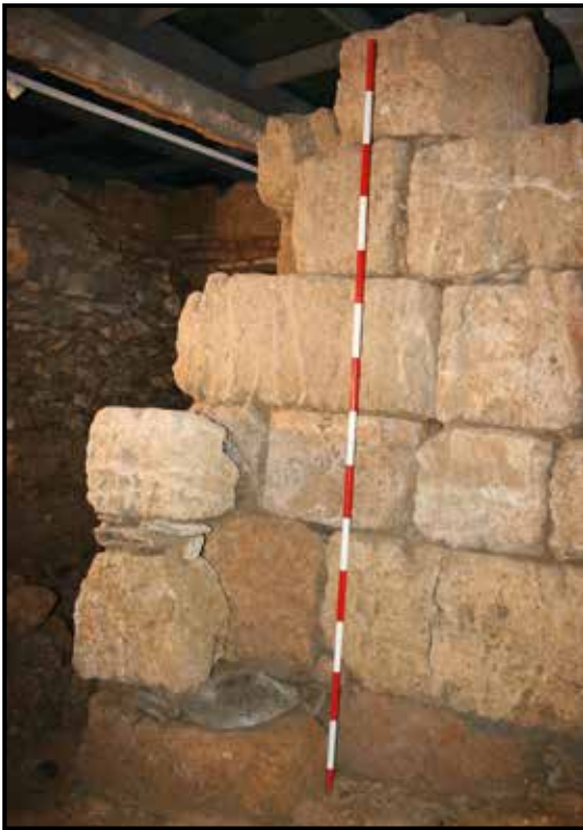
Detalle de la muralla