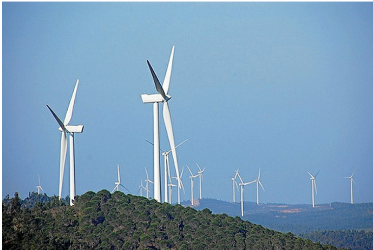
El complejo eólico se puso en marcha en el año 2010 aprovechando los recursos de la comarca.