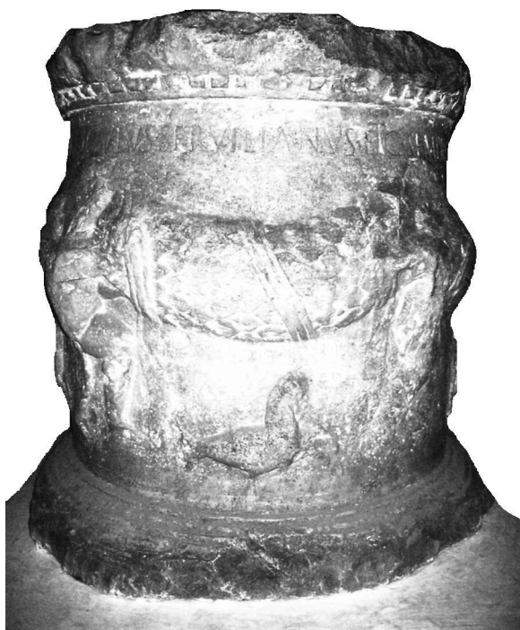
Fig. 5. Altar votivo dedicado a Augusto procedente de Trigueros (Huelva)

En el primero de los casos se sitúa la hipótesis planteada por D'Ors (1971: 255) basándose en su ausencia de la lista de las colonias de Plinio y en la interpretación del término colonus que aparece en los bronce de Vipasca para referirse a los ocupantes del territorio minero de Riotinto como extensivo del apelativo de colonia a todo el territorio minero onubense y no a un enclave concreto en su sentido tradicional. Recientemente, J.A. Pérez (2006: 64-66), contrariamente a lo sostenido con anterioridad, apoya similar argumentación. Esta hipótesis es contestada por J. González (1989: 129) que alude a la falta de otros testimonios que apoyen la relación entre el apelativo de coloni para los ocupantes de los pozos mineros y la extensión de esta denominación a la explotación minera, además de la inexistencia de un magistrado denominado PRO(curator) COL(oniae) . Además, observa falta de lógica en la denominación de una colonia con el nombre de otra ciudad; esto es, denominar con el nombre Onuba una explotación o distrito minero que por otra parte era conocido mediante otro nombre en la antigüedad – Urium .