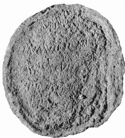
Fig. 4. Lingote de cobre hallado en el Pecio Planier 4 con referencia a la Colonia Onobensis

En lo que atañe a la lectura del lingote, encontramos varias posibilidades a lo largo de los últimos años. Así, F. Laubenheimer (Laubenheimer-Leenhardt, 1973: 78-82) se decanta por la lectura propuesta para la primera línea por M. Euzennat (1968-1970: - IMP(eratoris) ANTONI(ni)- ) en detrimento de las dos posibles lecturas sugeridas con ante-