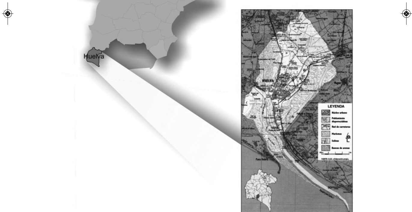
Fig. 1. Localización de la ciudad de Huelva.

Tal es el caso de la etapa romana, sobre la que disponemos de información razonable tanto en las fuentes literarias y numismáticas grecolatinas, en las que aparece citado el