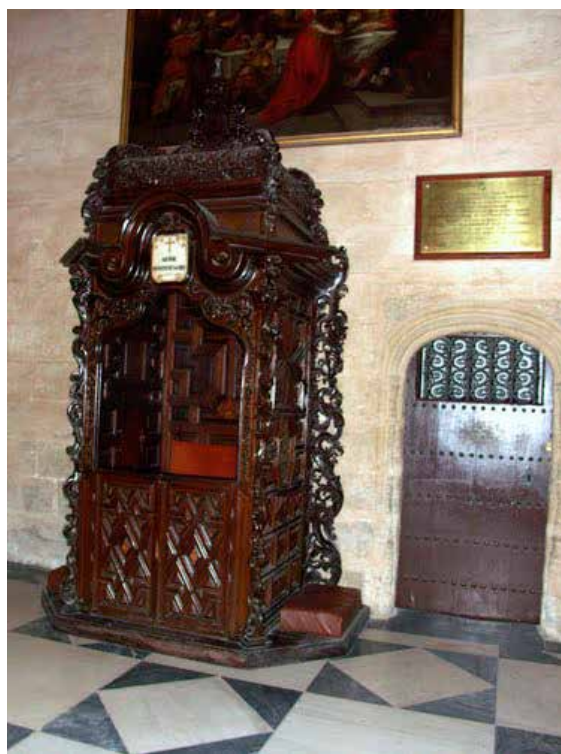
Fig. 6. Confesonario de la catedral de Sevilla.

Respecto al número de confesonarios en la iglesia catedral, recomienda tantos cuantos sacerdotes confesores se empleen para las distintas celebraciones. Por otra parte, en las iglesias parroquiales deben colocarse “dos confesonarios para que los varones no estén confusamente mezclados con las mujeres como tampoco muy apretadas entre sí cuando hay una numerosa concurrencia a la sagrada confesión... Pero en la iglesia parroquial en que hay numerosos párrocos, ecónomos, u otros sacerdotes, también coadjutores, que ejercen el deber de oír la confesión, igualmente deberán hacerse otros tantos confesonarios, cuantos en efecto son aquéllos” 26 (Fig. 6). Todos estos aspectos llevados a la práctica serán tratados por san Alfonso María de Liguorio en su “Praxis Confessarii” 27 , plasmación práctica de la gran transformación del espacio sagrado tras la aplicación de los decretos tridentinos en la que intervienen también estos olvidados ejemplos de la arquitectura en madera.