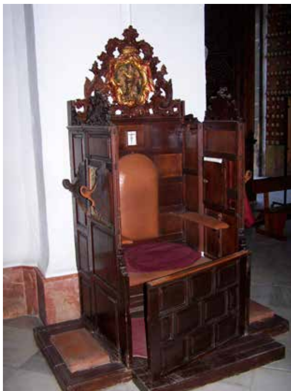
Fig. 4. Confesonario de la iglesia de Santa Cruz de Sevilla.

“Esta es la forma, de acuerdo con lo prescrito, de la cual deberá construirse el confesonario; habiéndola observado, se podrá emplear además algunos ornamentos, como las cornisas elaboradas en la parte anterior u otro género de ornato decente”.