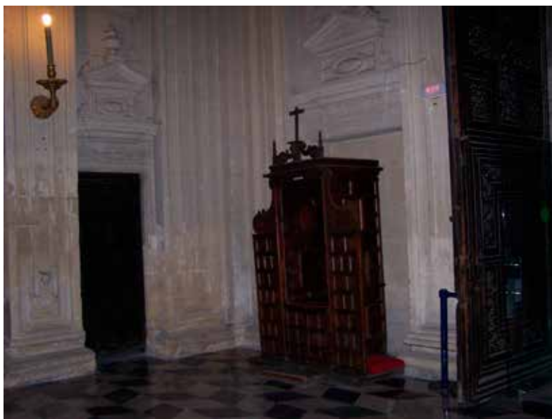
Fig. 5. Confesonario de la iglesia del Sagrario de la catedral de Sevilla.

“También en otros lugares de la iglesia, de acuerdo con la proporción de la amplitud y del sitio de la iglesia, con permiso del obispo alguna vez será lícito colocarlos como en ciertas capillas ampliamente extensas, o en su entrada o en el umbral, de tal modo que el confesonario esté dentro de los setos de reja, pero el penitente afuera; por lo cual hágase que con las rejas de la capilla sean apartados los que, concurriendo desordenadamente a la sacra confesión, y demasiado cerca de otro que entonces confiesa sus pecados, fácilmente perturban o al mismo penitente o al confesor” 25 .