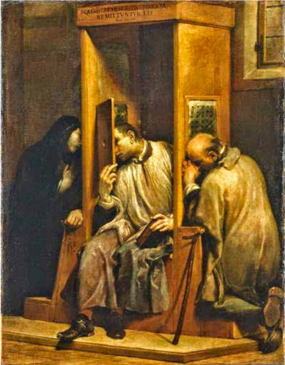
Fig. 1. Giuseppe María Crespi, “Confesión de la reina de Bohemia”, Galleria Sabauda, Turín.