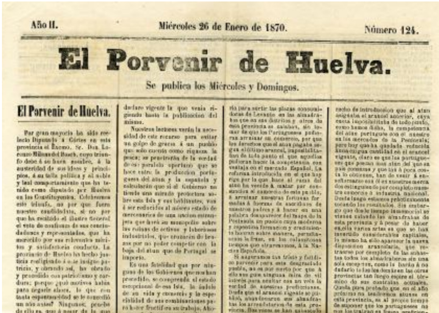
El Porvenir de Huelva , uno de los periódicos surgidos tras la Revolución Gloriosa, de corta duración

Su duración será mayor que la del resto en el caso del Centinela y la Federación, puesto que durarán 28 y 29 años, respectivamente. Díaz (2008b) acusa esta duración a la irregularidad de sus apariciones, que dejarían de ser semanales, como el resto de periódicos onubenses del Sexenio, para ser editados sin atender a una periodicidad fija y viviendo etapas sin publicar nada. Se dejan de encontrar números a partir de 1898, de ahí que se establezca ahí su fecha de finalización (Checa, 2011).