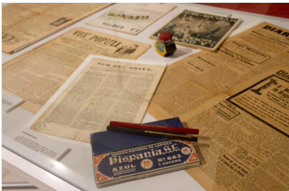
Muestra de la exposición 'Historia de la prensa en Huelva: la prensa onubense en el Archivo Municipal' (2011)

de obra empleada en grandes monocultivos olivareros extendidos por numerosas partes de la provincia (Díaz, 2008b). Así, la actividad periodística obrera sería mucho más prolífica e intensa sobre todo en las comarcas de la Cuenca Minera y el Andévalo, donde el movimiento sindical y obrero estaría acompañado de una prensa que le ayudase a expresar y difundir sus ideas.