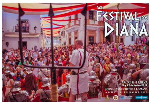
Fig. 5. Cartel anunciador del VI Festival de Diana.