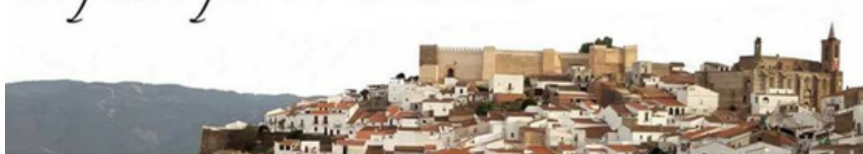
Figura 6. Oferta de turismo cultural-patrimonial de Aroche.

sas de estructuras, etc.) en la recuperación de lo que queda de la antigua Casa Palacio, restaurando todas aquellas fábricas y estructuras originales, así como creando espacios nuevos que se conectan de forma armónica con el resto del edificio. El hotel que pronto finalizará sus obras contará con 38 plazas, sala de reuniones-eventos y piscina en el corazón del Conjunto Histórico, entre la Iglesia de la Asunción y el castillo. Este hotel estará estrechamente vinculado al patrimonio de la localidad, sirviendo de nexo de unión entre los visitantes y la oferta de turismo cultural, además de generar una tipología de servicio no existente en la actualidad, con el añadido de la creación de empleo.