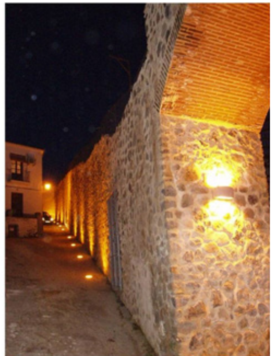
Fig. 1. Vista del antes y después de la intervención en la muralla.