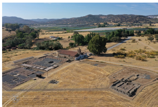
Figura 3. Vista aérea del Enclave Arqueológico de Arucci Turobriga y Monumental de San Mamés.

Entre las dos fases se han realizado en estos dieciséis años más de 100 intervenciones sobre el patri-