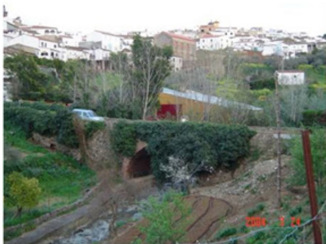
Fig. 2. Vista del antes y después de la intervención en el Puente de los Pelambres.

En la Fase de Madurez, que establecemos entre 2007-2019, es el momento de consolidación del proyecto. Destacan: Investigación, excavación y puesta en valor de la ciudad romana de Arucci Turobriga (Campos, Medina y Bermejo, 2017) (figura 3); Restauración de los frescos de la Ermita de San Mamés e impermeabilización de su cubierta; Restauración de los lienzos 1 al 7 del castillo, así como creación de la Sala del Alcaide y restauraciones en la plaza de toros; Intervención en el Convento de la Cilla para mejorar las instalaciones, impermeabilizar cubiertas, patios, reparación del chapitel dañado por un rayo, creación de la sala del Tesoro, renovación de mobiliario, creación de la Sala del Parque Natural o traslado y nueva exposición del Museo del Rosario; Restauración de 8 tramos de la muralla de Aroche, incluyendo tres de sus baluartes (Medina, 2018c y e.p.a) (figura 4); Restauración de la Torre de San Ginés; Impermeabilizaciones y reparación de cubiertas en la Iglesia de la Asunción, así como trabajos de restauración interior; Restauración de la Casa Palacio Conde del Álamo para la creación de un Hotel; En el Conjunto Histórico se ha intervenido en calles, muros, empedrados, plazas, iluminación, eliminado de cableado aéreo, delimitación