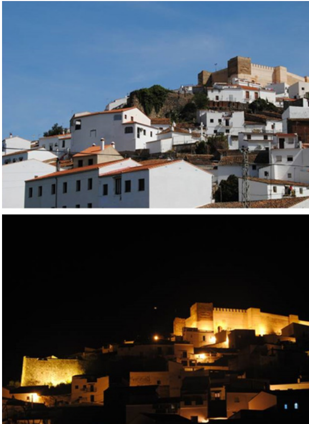
Figura 4. Vista del antes y después de la intervención en el Baluarte de la Cota.

monio. En 2018, el Proyecto Patrimonio de Aroche fue reconocido con el Premio Sísifo otorgado por la Universidad de Córdoba, el Grupo de Investigación Sísifo y la Asociación Cultural Arqueología Somos Todos, y que reconoce y premia a instituciones o personas que hayan destacado a nivel local, regional, nacional o internacional, en la investigación, defensa o divulgación del Patrimonio Arqueológico.