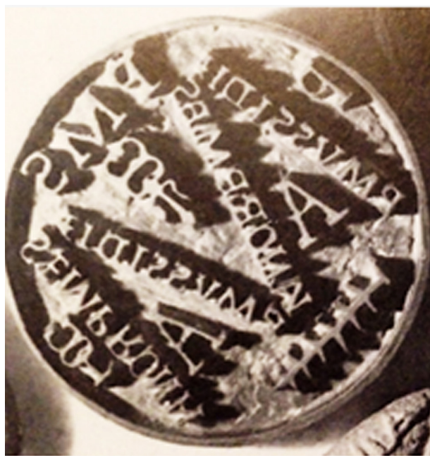
Figura 5. Sello de P. Mussidius Sempronianus

Los Mussidii eran una gens plebeya de escaso relieve, originarios de Sulmo , única localidad, junto a la propia Roma, donde hay testimonios de su presencia (Wiseman, 1964, 122-133). Algunos de sus miembros ocuparon cargos de relieve en la administración imperial, y uno de ellos, T. Mussidius Pollianus llegó al consulado en el reinado de Caligula. En Hispania tan solo hay testimonio de una familia en Gemella (CIL, II2/5, 901 = HEP., 8, 1998, 153) y en un epígrafe de Benifallet (TA) (IRC V, 123a; HEP., 18391: C(aius) Mussid(ius) Nep(os) ).