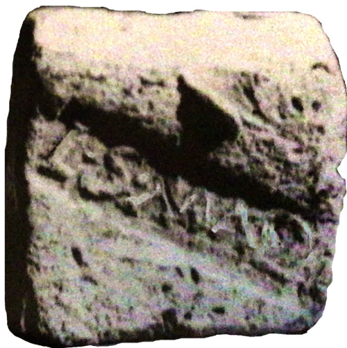
Figura 1. Pondus con inscripción

Sus dimensiones, estructura y material nos recuerdan ciertas piezas, muy frecuentes, utilizadas como unidades de peso, aunque solo raramente presentan algún texto epigráfico. En su identificación tal vez nos ayude el peso de unos 25 gr., que su propietario me indicó que tenía (aunque no pude confirmar este dato), y que vendría a coincidir a grosso modo con los 27,4 gr. de valor de una uncia .