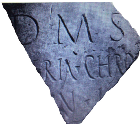
Figura 6. Inscripción de Valeria Chro[---]

La restitución de la parte perdida presenta algunos problemas por la ausencia de márgenes laterales, sin embargo, la parte conservada del nomen de la difunta -eria , nos lleva a pensar en nombres como Valeria , Laberia u otro similar, inclinándonos por el primero por la frecuencia de este en los registros epigráficos de la Bética. El cognomen con