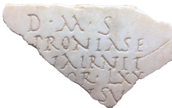
Figura 3. Inscripción de Sempronia Severina Irnitana

“Consagrado a los dioses Manes. Sempronia Severina?, natural de Irni, de 70 años, cariñosa con los suyos, está aquí enterrada. Sea para ti la tierra leve”. (González, 2013, 256-257).