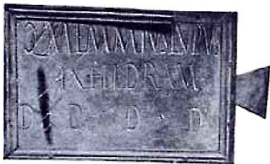
Figura 4. Tabula ansata de Q. Memmius Lupus (Berlanga)

Hübner la fecha, según el tipo de letra, a finales del siglo I o principios del II, que vendría a coin-